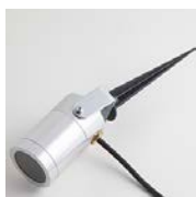
Silver lampa med svart markspett och svart kabel