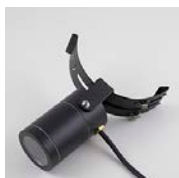
Svart lampa med svart hållare och svart kabel

Hammarlunda har tagit fram patenterad produkt som är en elegant fasadbelysning i LED som du enkelt monterar genom att klämma fast den flexibla hållaren i hängrännan. Du behöver ingen elektriker eller hantverkare och gör ingen åverkan på din fasad. Du kan enkelt koppla flera stycken efter varandra. Lamporna finns i flera olika varianter. Ett 12Volt system som du själv väljer hur du vill bygga ihop.