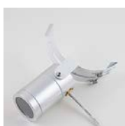
Silver lampa med vit hållare och vit kabel

Artikelnummer RP40 (2,5 Watt) RP44 (4,5 Watt)