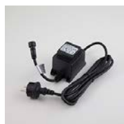
Transformator 60 Watt