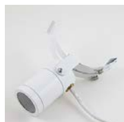
Vit lampa med vit hållare och vit kabel

Artikelnummer RP50 (2,5 Watt) RP55 (4,5 Watt)