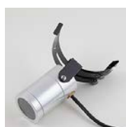
Silver lampa med svart hållare och svart kabel

Artikelnummer RP60 (2,5 Watt) RP66 (4,5 Watt)