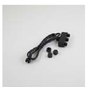
Grenkoppling 1:3 med svart kabel