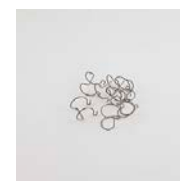
Rostfria clips 8 st

Artikelnummer RP100 (1 meter) H2013006 (5 meter) RP200 (2 meter) H2013007 (10 meter) RP300 (3 meter)