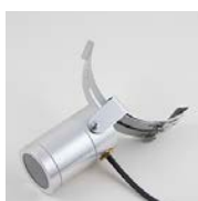
Silver lampa med silver hållare och svart kabel

Artikelnummer RP30 (2,5 Watt) RP33 (4,5 Watt)