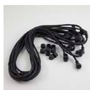
9 meters kabel med 8 uttag