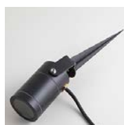
Svart lampa med svart markspett och svart kabel

Artikelnummer RP20 (2,5 Watt) RP22 (4,5 Watt)